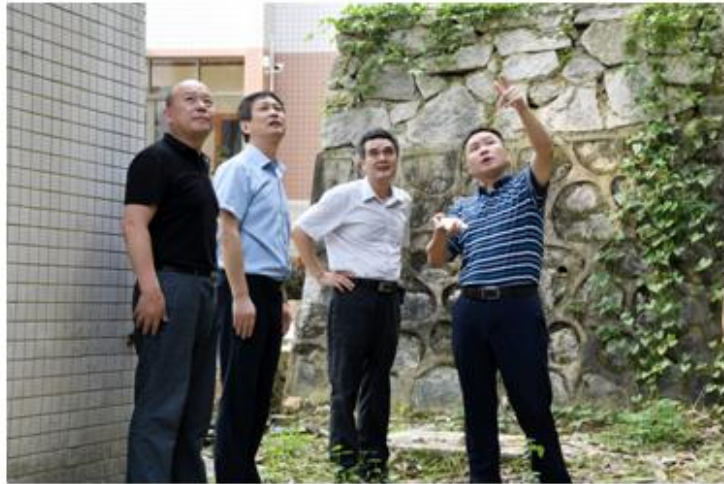
张胜年副巡视员来我院指导工作

台风来临前，市人社局张胜年副巡视员来我院视察工作，并对我院抵御台风做出了指导。同时，院党委班子成员高度重视，通过参加和召开会议、制定应急预案、实时监控台风动向、撤离服务对象、集中管控人员、水库泄洪等措施，为抵御台风，做了充分的准备。