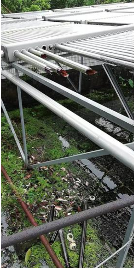
被台风损坏的热水管