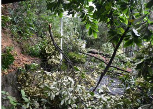
被台风损坏的树木