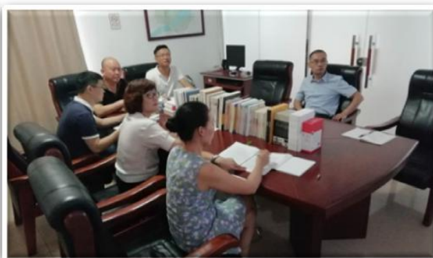
小组党员踊跃发言