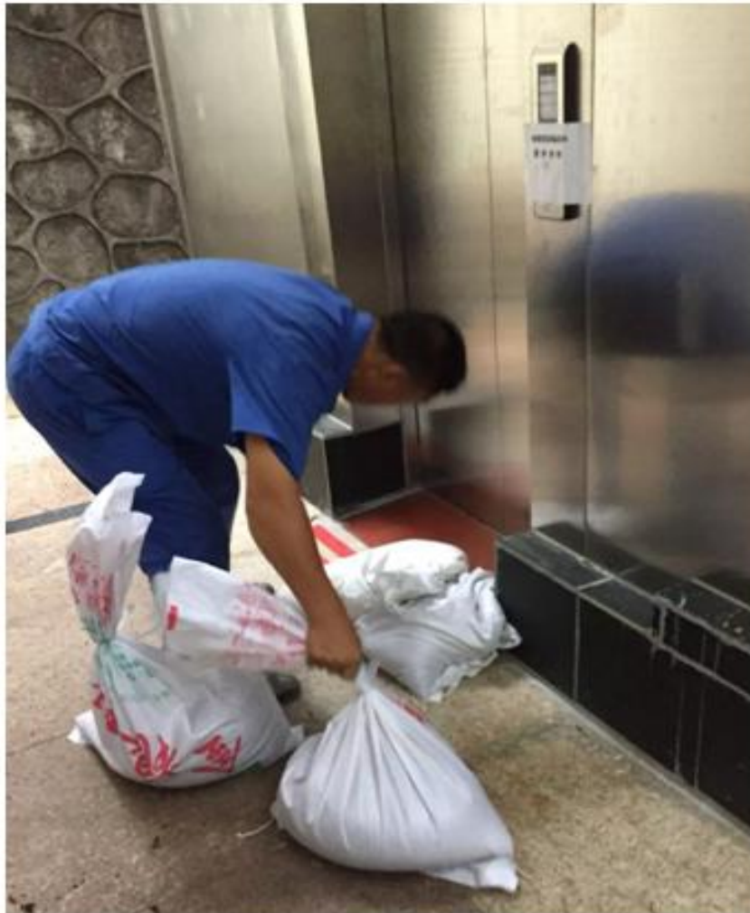
我院员工在利用沙袋防水

台风来临时，院领导、抢险及后备人员共 100 余人坚守岗位，及时提醒，监控院情，把我院的损失控制到最小。