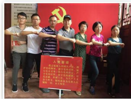
（带领小组党员参加党支部活动——参观农民运动讲习所）。