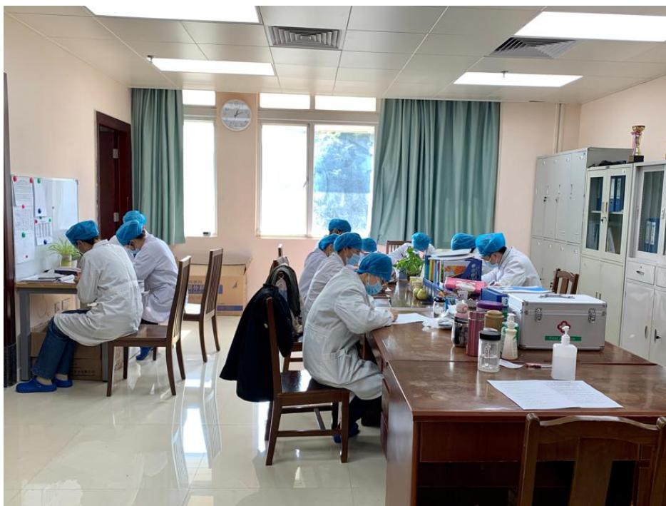
检验科全体工作人员集中考试

为深入推进党的政治建设，用习近平新时代中国特色社会主义思想武装头脑、指导实践、推动工作，有效推动基层科室党建工作与业务工作融合发展，11月30日下午，第三党支部联络科室检验科开展“党员干部应知应会知识”考试。