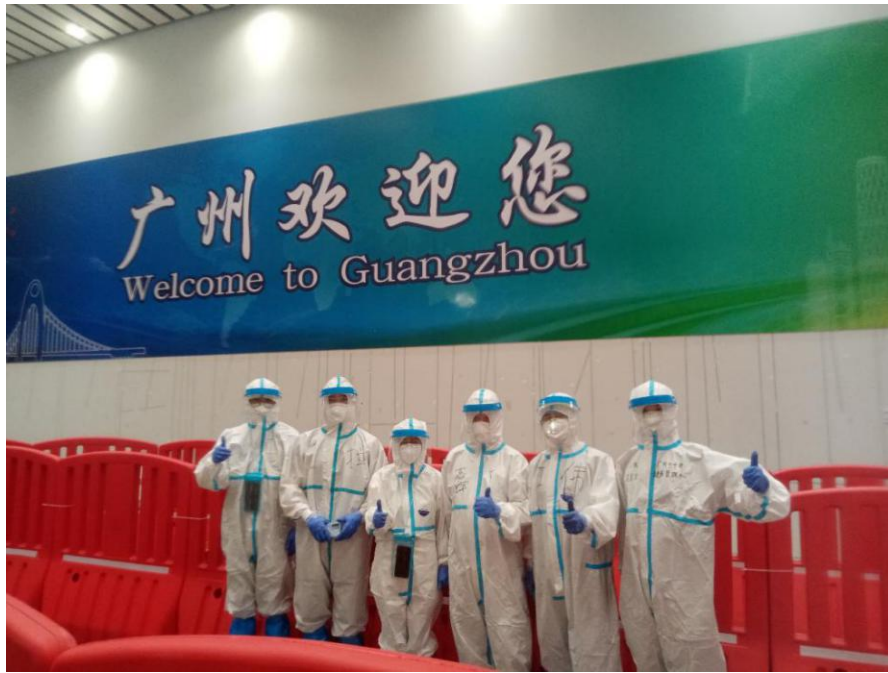
机场专班现场服务组的同志们