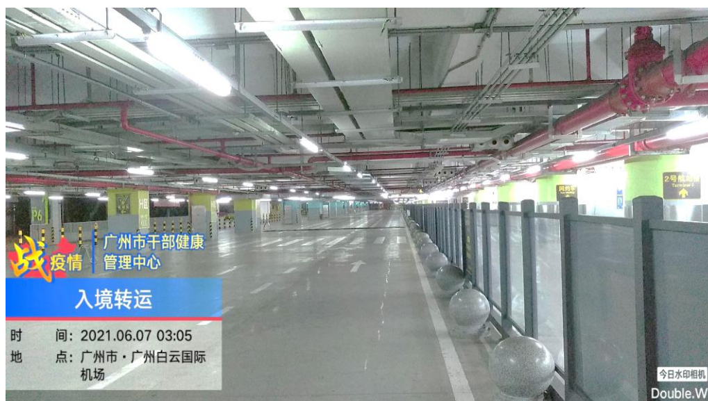
凌晨的白云国际机场

说起这次支援机场防控专班工作，他依然激情满怀，“2020年新冠肺炎疫情发生至今，耳闻目睹了抗疫一线那么多感人事迹，尤其是广大疫情防控一线工作者作出的巨大牺牲，内心触动很大！作为一名共产党员，能参加白云机场疫情防控专班任务，实现了我上‘前线’为祖国出一份力的愿望！”