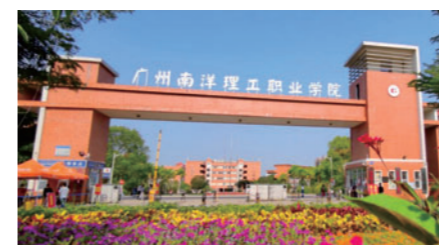
广州南洋理工职业学院