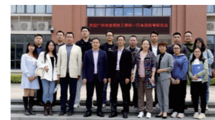
广州华南商贸职业学院