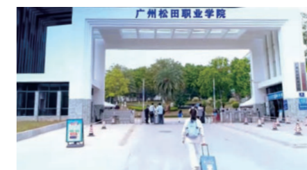
广州松田职业学院