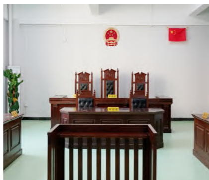
法律事务实训法庭