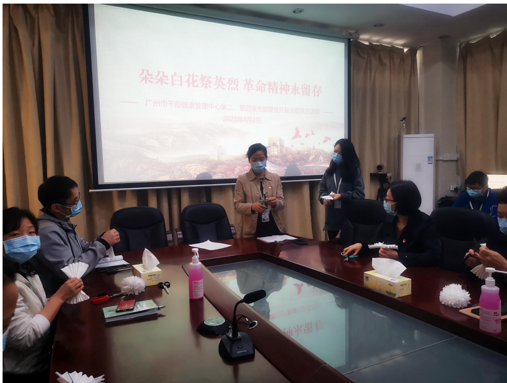
图为同志们在动手制作小白花

清明将至，为缅怀革命先烈，传承红色基因，2022年4月2日，广州市干部健康管理中心第二、第四党支部联合开展了“朵朵白花祭英烈，革命精神永留存”主题党日活动。活动内容有三项：制作小白花、网上祭英烈、讲烈士故事。