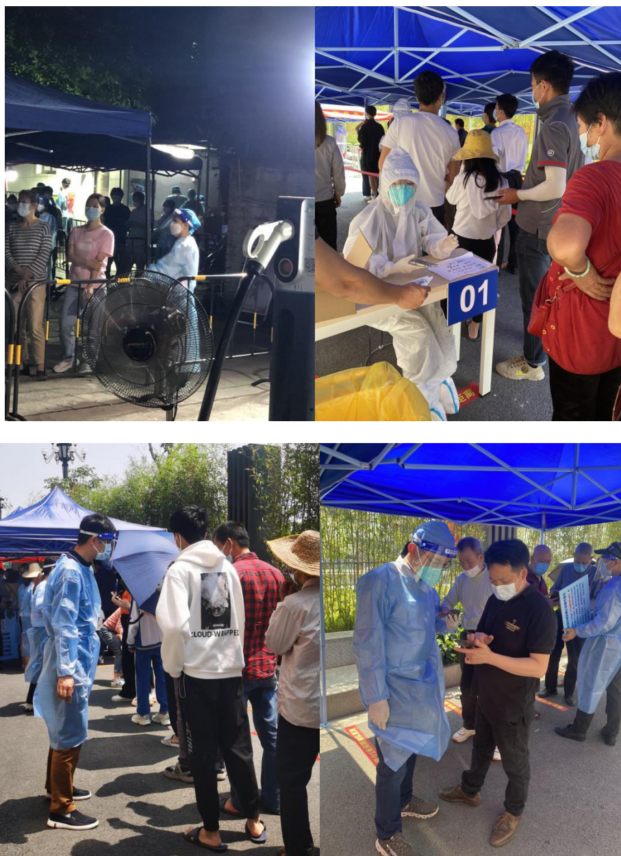
图为党员干部积极投入社区疫情防控志愿工作

的坚定意志和服务群众的高尚品质，是新时代岭湖人迎难而上、勇担使命、冲锋在前的真实写照。“上下同欲者胜”。在党中央集中统一决策，省、市具体部署下，广大共产党员同人民群众勠力同心，必能早日战胜本次疫情。