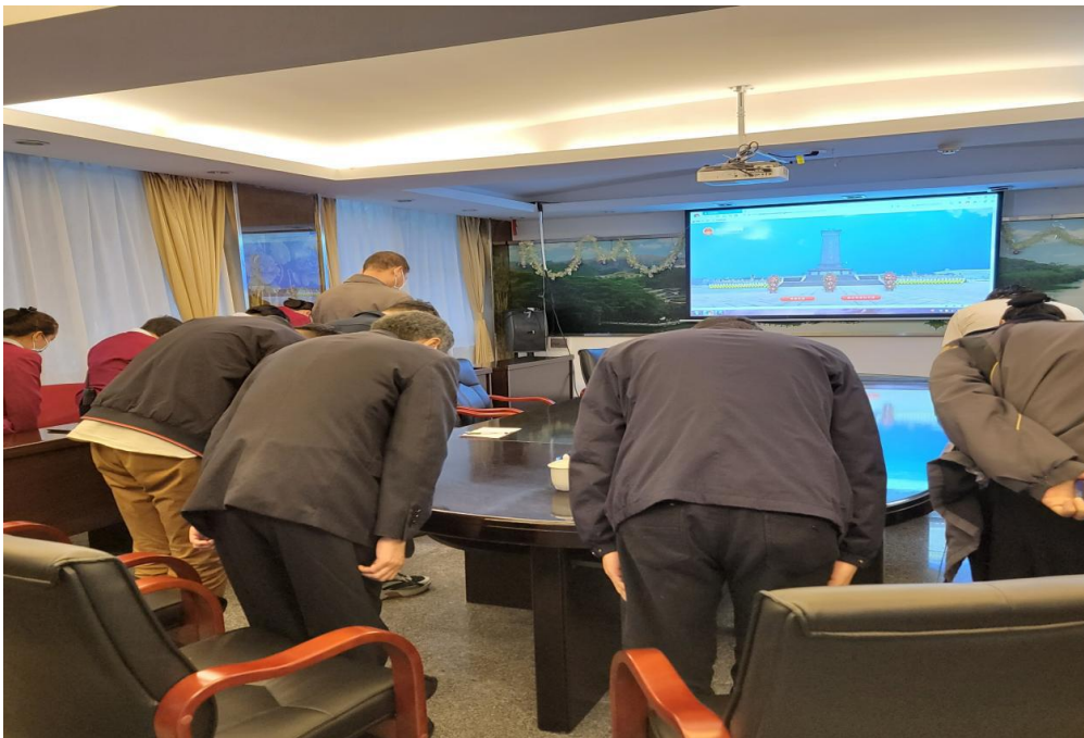
图为同志们向革命先烈鞠躬表达哀思

2022年4月2日，第五党支部的同志们以云祭奠的方式登录中华英烈网，并跟随着相关指引向革命先烈鞠躬、献花、敬献花圈，抒写寄语，用屏幕传达崇敬之感、遥寄哀思之情。