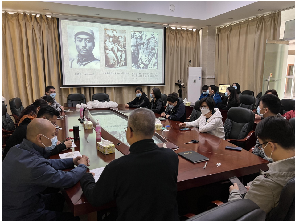
图为同志们在聆听英雄故事

杨靖宇烈士为了理想信念浴血奋战、舍生取义的精神深深感动了同志们。大家表示，共产党员必须要有坚定的理想信念，必须要有为了理想奋不顾身、舍身忘我的精神，在世纪疫情和百年变局交织的时代背景下，更要继承和发扬革命烈士的英雄品质，为实现中华民族伟大复兴作出贡献。