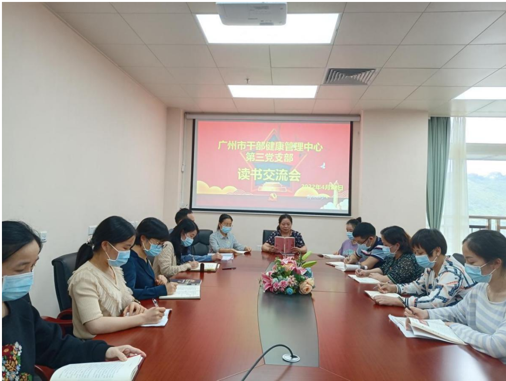
图为同志们在分享好书

书籍是人类知识的载体，是人类进步的阶梯。4月22日，在第二十七个世界读书日到来之际，广州市干部健康管理中心第三党支部开展了“读书修身，书香追梦”读书交流会主题党日活动。