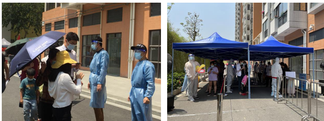
图为中心党员在岭头社区开展全员核酸检测

4月9日凌晨，我中心接到共建街道（社区）——长岭社区紧急支援的请求，于9日协助社区组织居民进行全员核酸检测。中心党员同志们积极响应，短时间内集结了一支由14人组成的党员先锋队小分队，紧急驰援岭头社区。