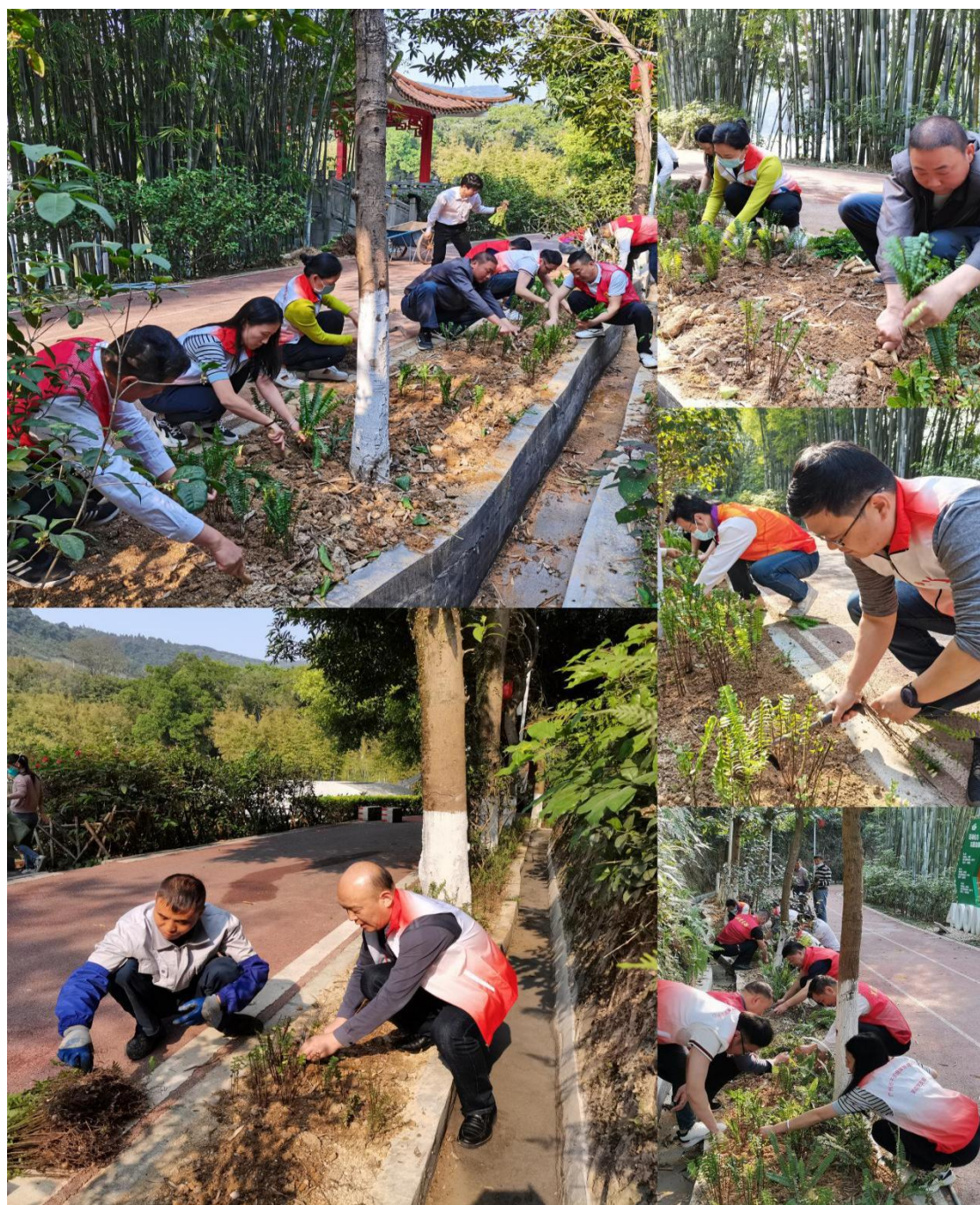
同志们在环湖绿道旁植树种草

第二组的同志手拿锄头、水桶、铁锹，在环湖绿道旁，植树种草。大家互相配合，有的挥锹铲土、有的扶苗填土、有的培土浇水，忙得不亦乐乎。经过一个多小时的劳动，300棵肾蕨在绿化带里“安家落户”，环湖绿道边又添上了一片新绿。