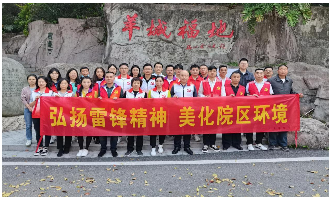
学雷锋志愿服务活动合影

阳春三月，春意盎然。为进一步弘扬“奉献、友爱、互助、进步”的志愿精神，积极响应习近平总书记对深入开展学雷锋活动作出的重要指示，广州市干部健康管理中心第四、第五、第六党支部联合中心团支部在学雷锋月及植树节到来之际，在院区环湖绿道开展“弘扬雷锋精神 美化院区环境”学雷锋志愿服务活动。