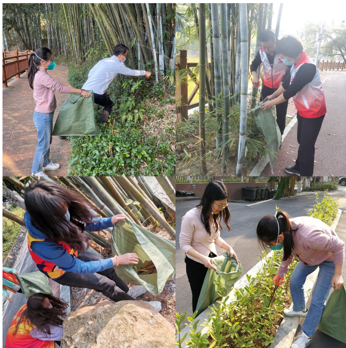
同志们在开展环境卫生整洁行动

第一组的同志们手提簸箕、扫帚，在院区绿化带、楼宇周围、停车场等公共区域开展环境卫生整洁行动，按照安排的路线，活动井然有序地进行。同志们热情高涨，有的弯腰在绿化草地中、小坡上拾捡垃圾，有的挥舞扫帚清扫道路上的树叶，还有的把绿化带杂草清理干净。大家都认真仔细地“搜寻”着，不让任何一个角落被“遗忘”。