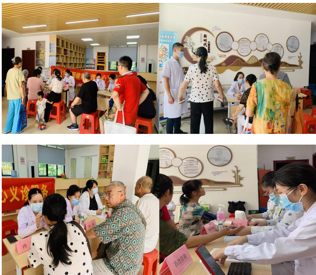
医护人员热情接待前来问诊的居民

指导、心理知识科普、医保政策解答、药物咨询等多个项目。前往活动现场的居民络绎不绝，医护人员热情接待每一位前来问诊的居民，为他们细致检查，并耐心地解答居民提出的健康保健、疾病预防等问题，向他们讲解普及相关疾病的预防保健知识，引导居民以健康积极的心态应对健康问题。