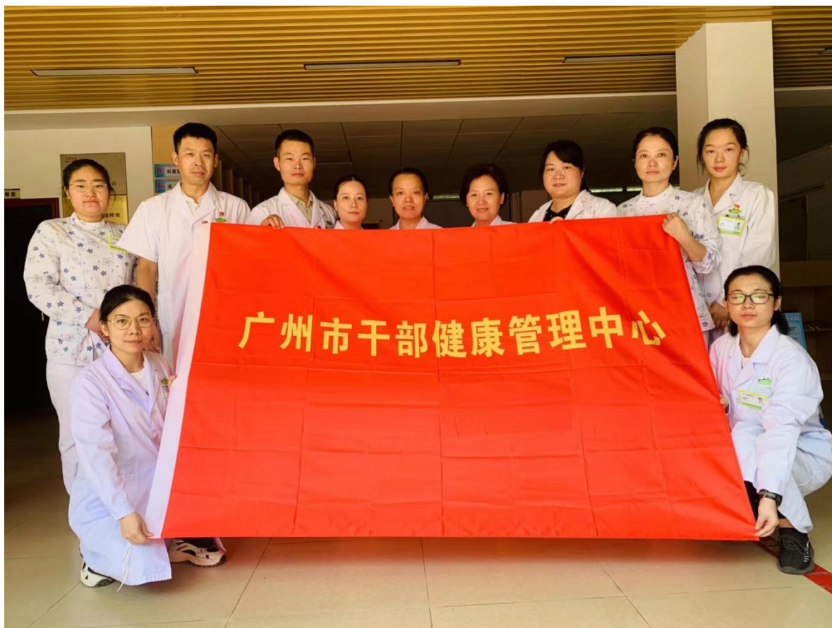
活动后医疗队合影

广州市干部健康管理中心将充分利用医疗资源，携手社区，持续开展新时代文明实践志愿服务，进一步关心关爱社区居民身心健康，不断提升市民群众的获得感和幸福感。