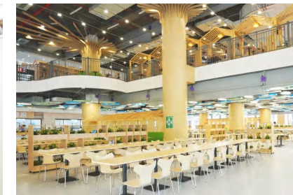
菜品丰富的学生餐厅