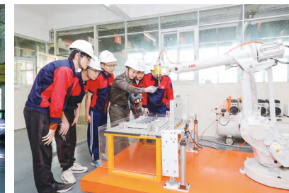
工业机器人工作站实训室