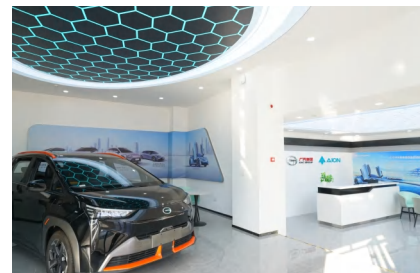
广汽埃安新能源汽车实训中心