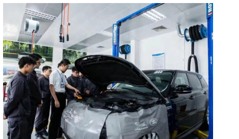
捷豹路虎培训中心