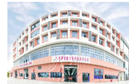
世界技能大赛重型车辆技术项目中国集训基地