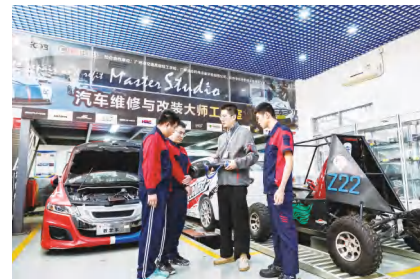
汽车维修与改装大师工作室