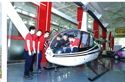
世界技能大赛飞机维修项目广东省集训基地