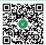
花都技校微信公众号

招生就业办简主任：13570292187 招生就业办陈老师：13535375566 招生就业办植老师：13422160883 招生就业办刘老师：18011888316 招生就业办电话：（020）86809755 （020）66850644