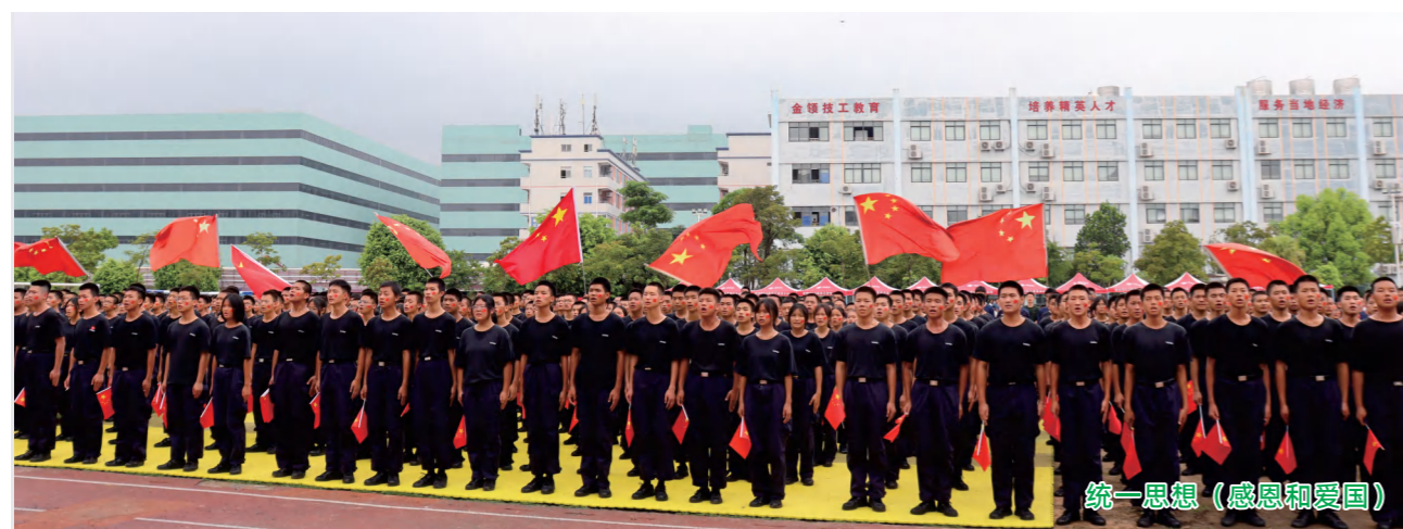
统一思想（感恩和爱国）