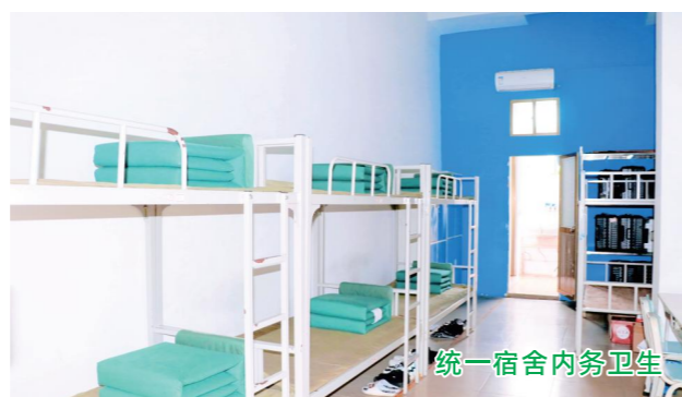
统一宿舍内务卫生