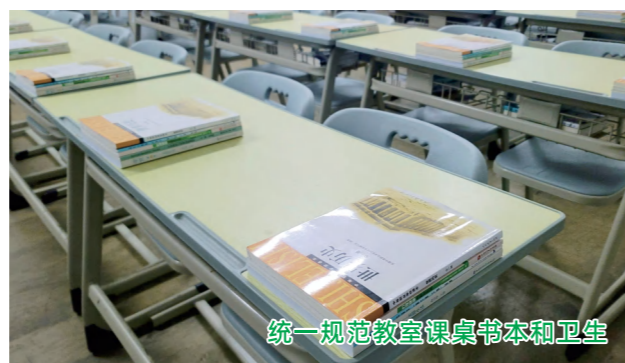
统一规范教室课桌书本和卫生