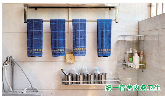
统一宿舍内务卫生