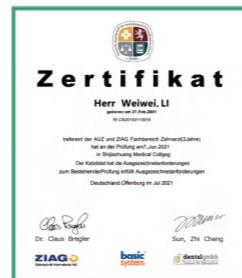
德国牙科技术协会颁发的 技术等级评定证书

目前德标体系每年的毕业学生为3500人左右，目前市场需求人数在2~3万学生，德标体系的实施，可以带动更多学生高质量高收入的就业。