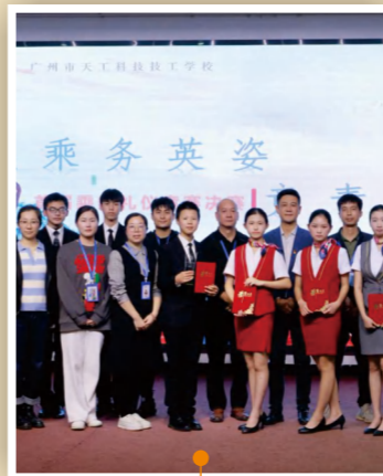
首届乘务礼仪竞赛

学校鼓励师生积极参加各校内外活动竞赛，通过开展和参加活动竞赛丰富了师生的校园生活，提升了师生的综合技能，实现用比赛促管理，用比赛促竞争，用比赛促提高，用比赛促教学的目的。