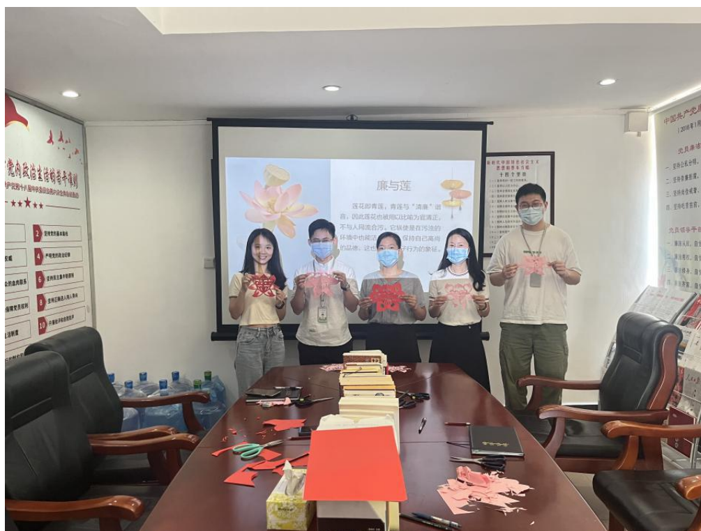
图为同志们在展示自己的作品

家风正，则民风淳；家风好，则国风清。家风家教不只是小事、私事，更关系到社会和谐稳定和国家繁荣发展。希望广大党员干部能扣好人生的第一颗扣子，以良好家风推动党风政风清正、社风民风淳朴。