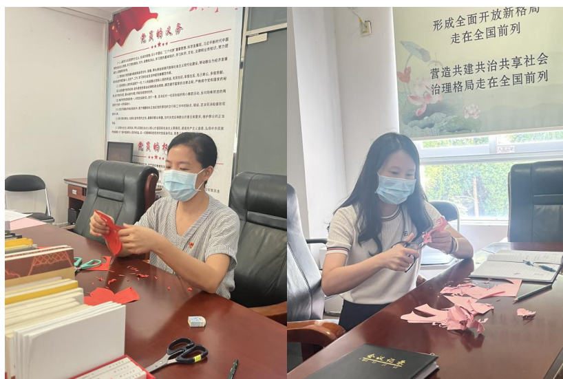
图为同志们在剪纸

家风正，则民风淳；家风好，则国风清。家风家教不只是小事、私事，更关系到社会和谐稳定和国家繁荣发展。希望广大党员干部能扣好人生的第一颗扣子，以良好家风推动党风政风清正、社风民风淳朴。