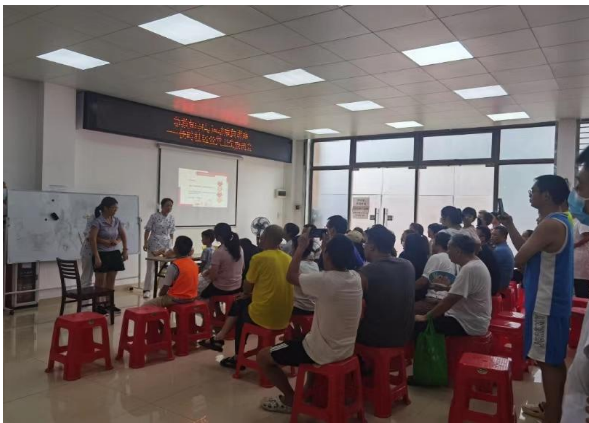
义诊现场：专业与关怀并重

为深入贯彻国家“健康中国”战略，推动优质医疗资源下沉至社区，广州市干部和人才健康管理中心第一、第二和第六党支部联合长岭社区，于2024年9月21日和28日在奥园春晓社区、龙湖揽境社区成功举办了公益义诊活动。活动旨在提升社区居民的健康意识和自我保健能力，促进居民身心健康。