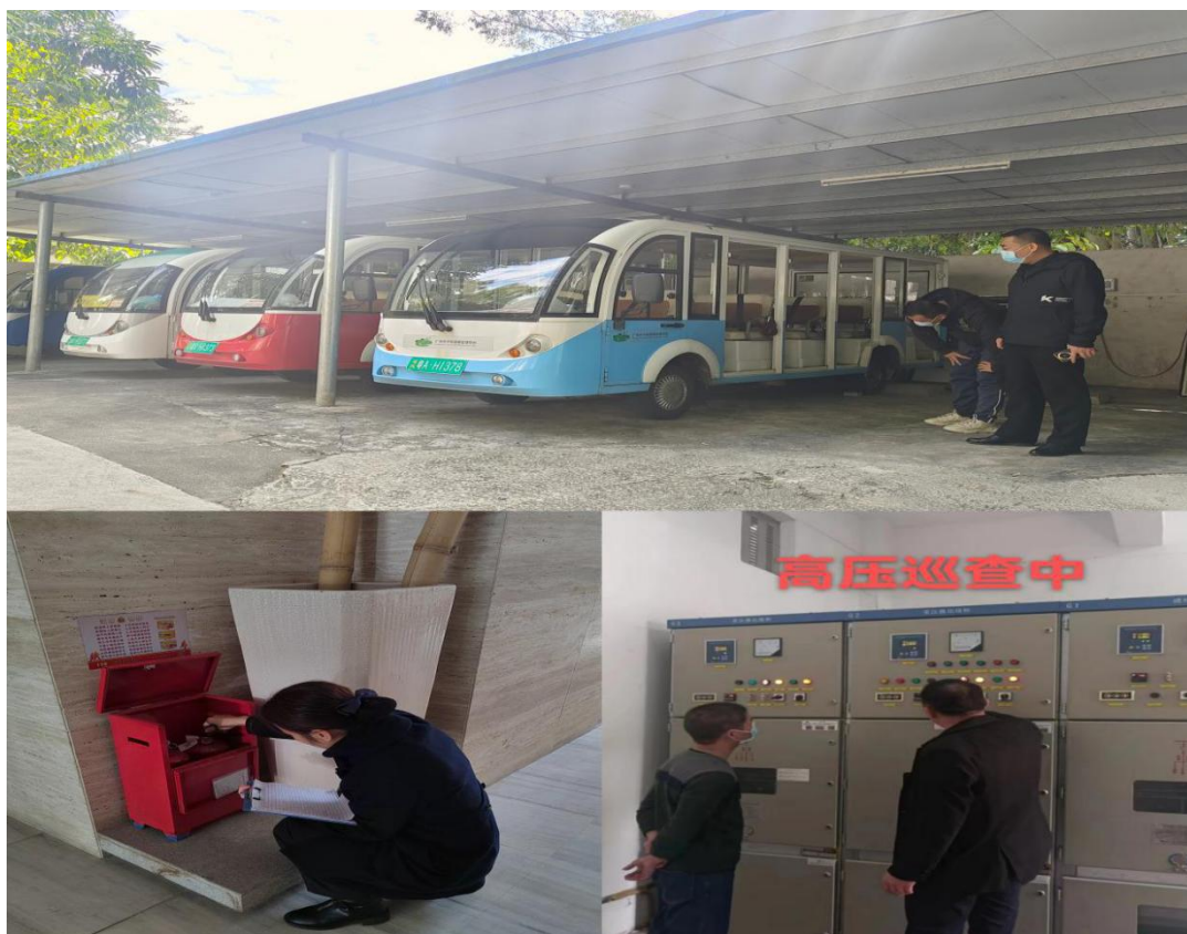
各部门开展安全隐患排查

判复工期间可能出现的各类安全风险，科学制定复工复产方案，确保中心各项工作平安有序。