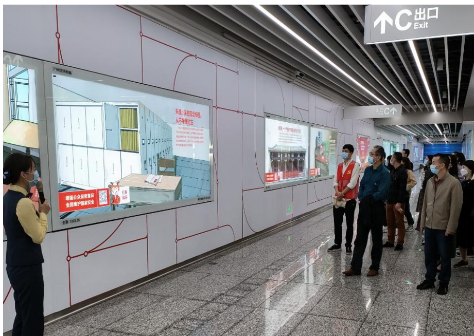
同志们在认真听保密普法讲解