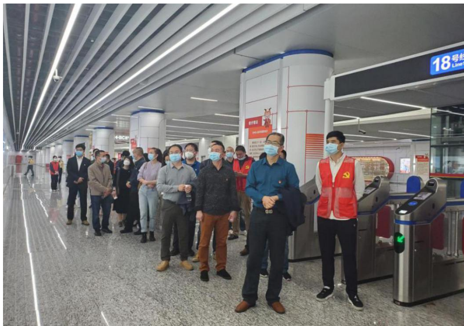
同志们在龙潭地铁站保密普法示范基地参观学习

站立的是以“羊”的形象为原型、代表安全和正义的宣传大使——密仔。而整个展厅便是以“密仔普法”的形式，向公众普及相关的保密法律法规，强化公众保密法治观念。