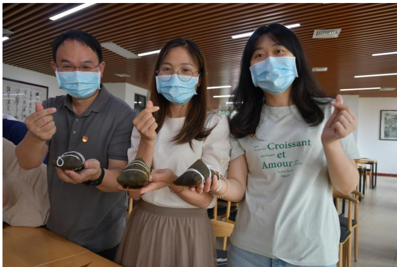
图为同志们在展示自己包好的粽子

端午节作为首个入选世界非遗的中国传统节日，凝结着悠久的历史，蕴含着健康祈愿、爱国主义等丰厚的文化内涵。同志们深刻领悟到中华优秀传统文化是民族的精神命脉。大家表示，要不断提高民族意识，增强文化自信，继承优秀传统文化，弘扬中华民族精神，努力推动建设社会主义文化强国。