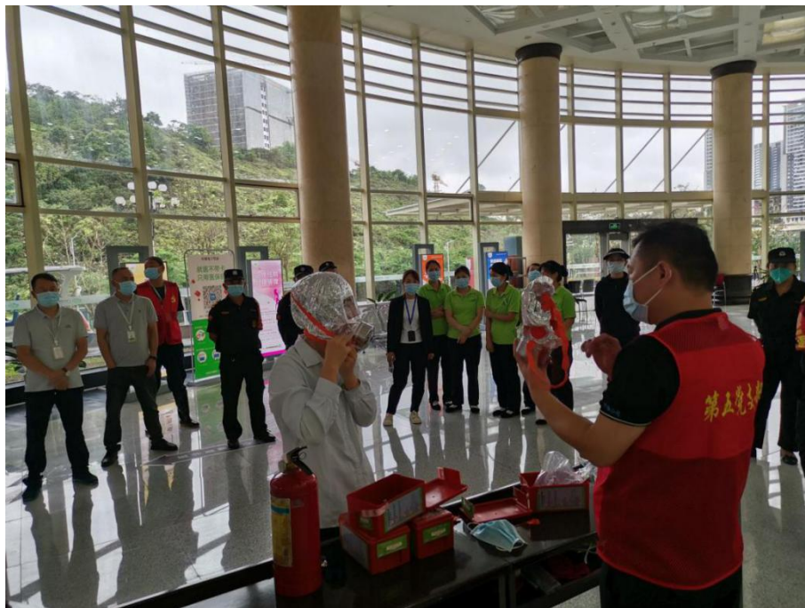
5月12日，广州市干部健康管理中心开展全国防灾减灾日新时代文明实践志愿宣传活动。图为志愿者在进行防毒面罩使用讲解。