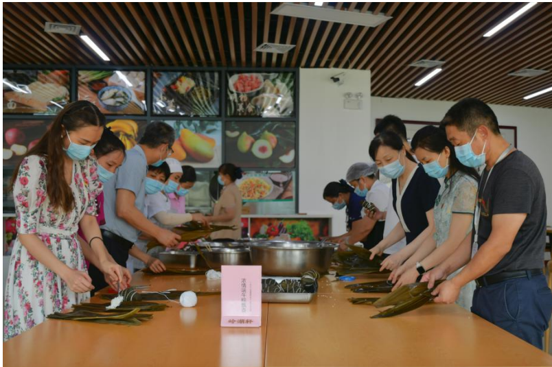
图为党支部同志们在体验包粽子