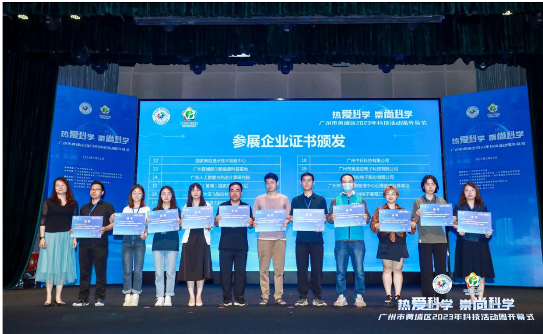
广州市干部健康管理中心获广州市科技局“热心科普基地证书”