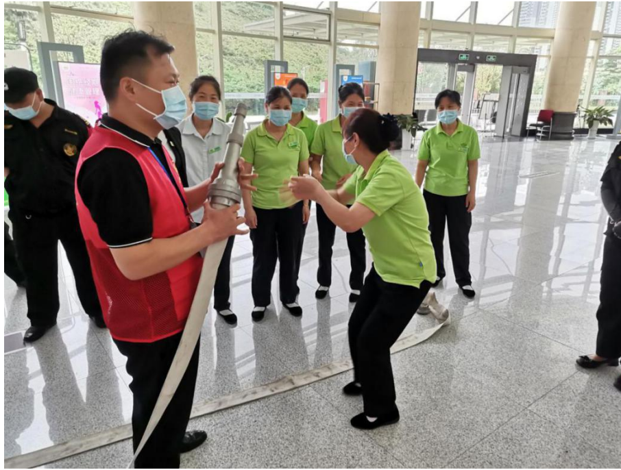
5月12日，广州市干部健康管理中心开展全国防灾减灾日新时代文明实践志愿宣传活动。图为志愿者在进行消火栓使用讲解。