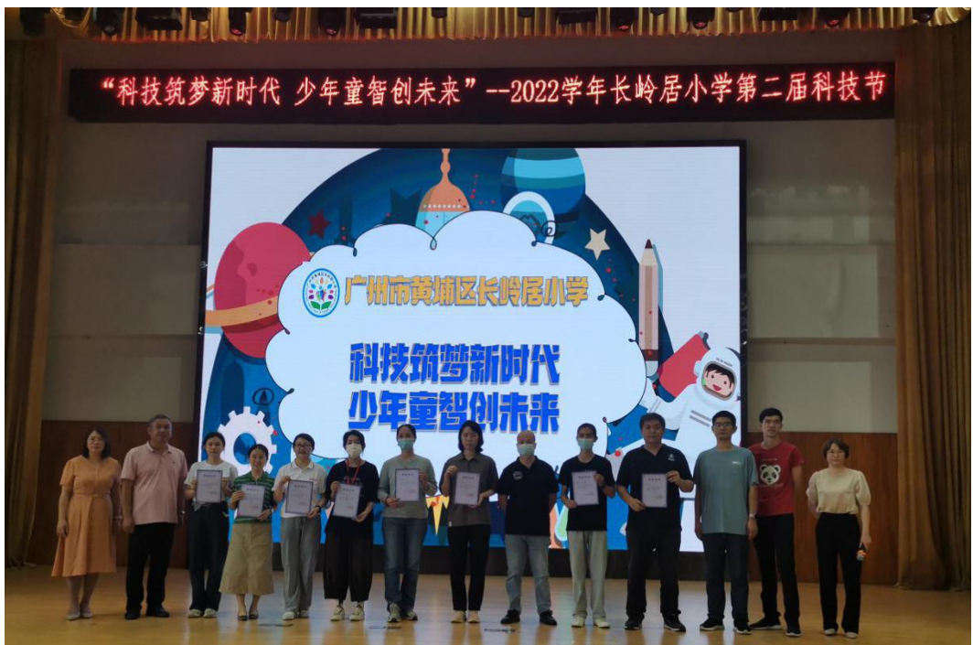
广州市干部健康管理中心获黄埔区长岭居小学表彰