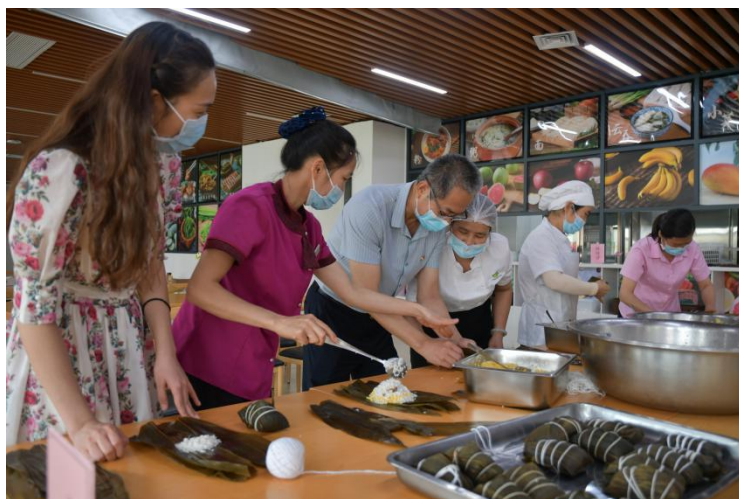
图为餐厅员工耐心指导同志们包粽子

为推进文化强国建设、弘扬中华优秀传统文化、品味端午民俗，2023年6月15日，端午来临之际，广州市干部健康管理中心第六党支部在职工餐厅开展“浓情端午粽飘香”主题党日活动，在浓浓的民俗气息中，领略传统文化风采。