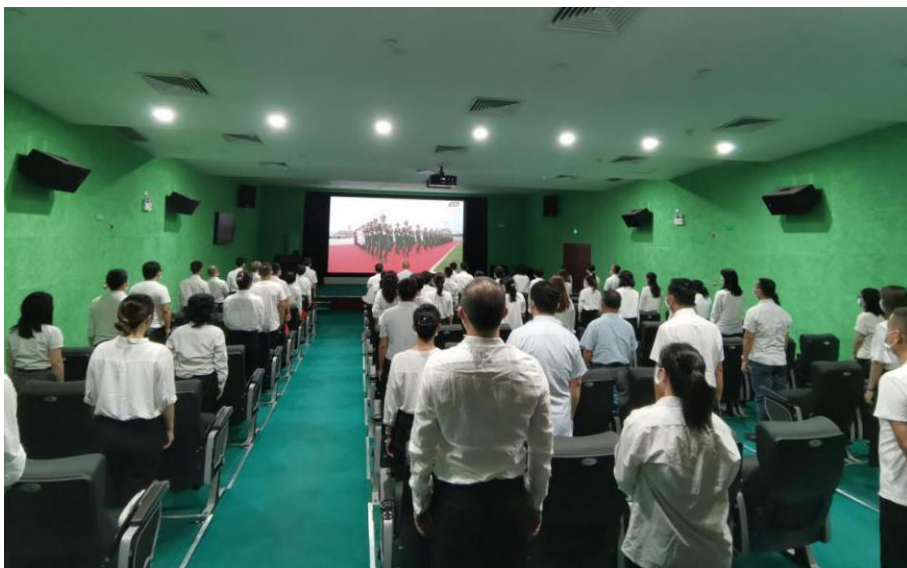
广大党员干部收看大会直播

收看庆祝中国共产党成立100周年大会直播。上午8时，中心党员干部准时在心灵剧场，收看中央电视台直播“庆祝中国共产党成立100周年大会”。同志们手持党旗、国旗，与大会现场同步欢庆。在习近平总书记发表振奋人心的重要讲话时，同志们兴奋地挥舞手中旗帜，同现场一道高呼“好”“中国共产党万岁”。总书记在讲话最后，高举右臂，喊道“伟大光荣正确的中国共产党万岁！伟大光荣英雄的中国人民万岁！”，把大会推向高潮，中心观看现场也随之热情高涨。